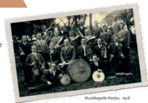
Musikkapelle Riedau - 1928

Kontaktadresse für Bilder: Carina Straßer Stieredt 2, 4752 Riedau carina.strasser15@gmail.com